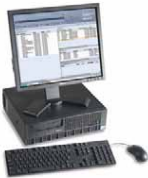
Xerox® FreeFlow® Print Server

Jeder Server ist auf bestimmte Workflow- und Anwendungsanforderungen spezialisiert. Ihr Xerox Ansprechpartner hilft Ihnen, den für Sie optimalen Server auszuwählen.