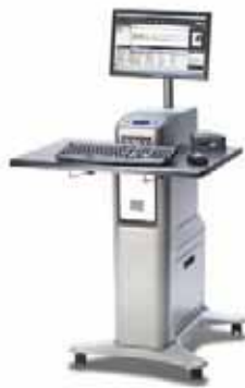
Xerox® EX Print Server, Powered by Fiery®